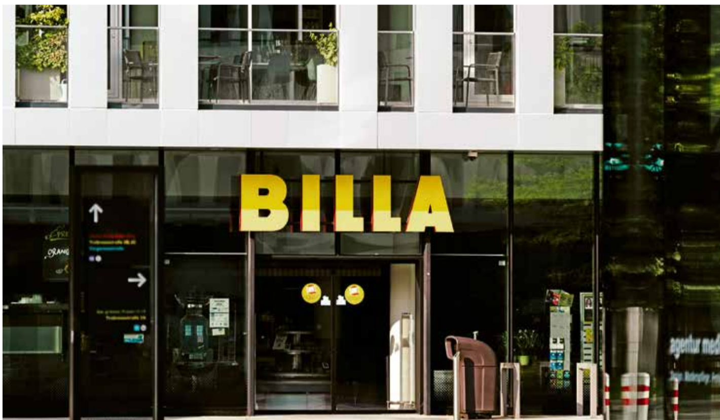
Tržby Bille vzrástli o deväť percent, zisk o tri.