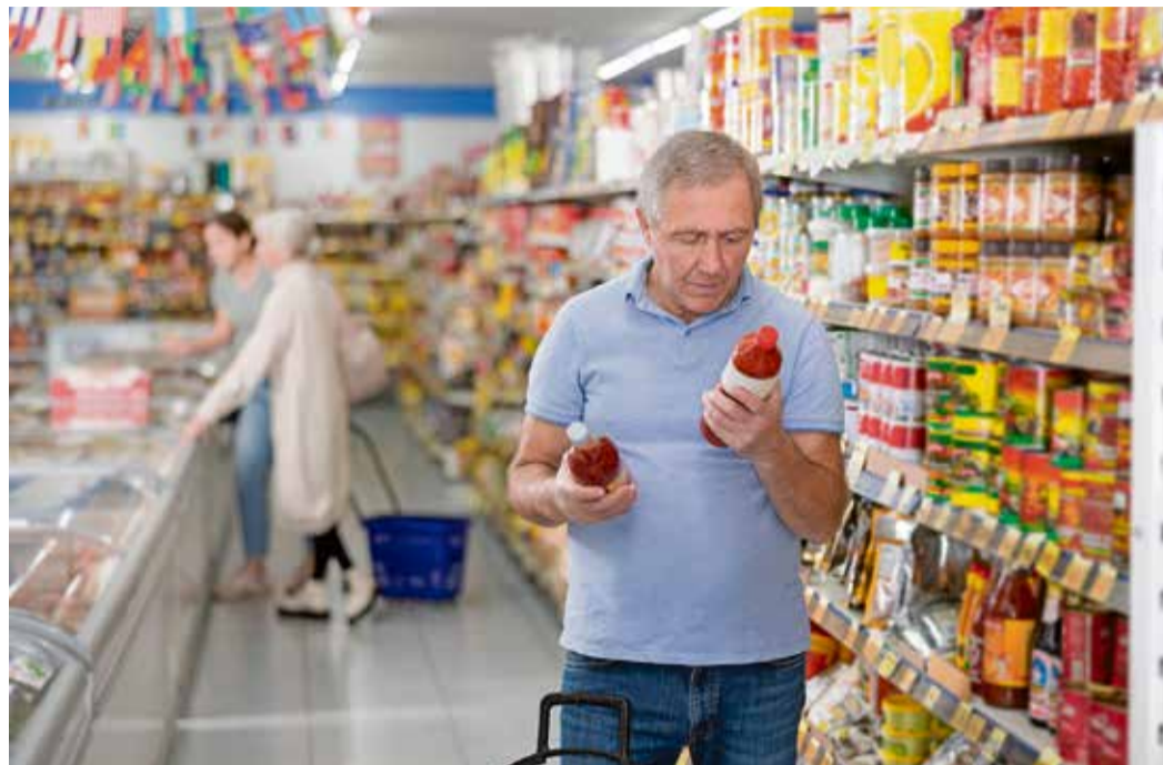
Zmeny spotrebiteľského správania si všímajú aj maloobchodné reťazce.